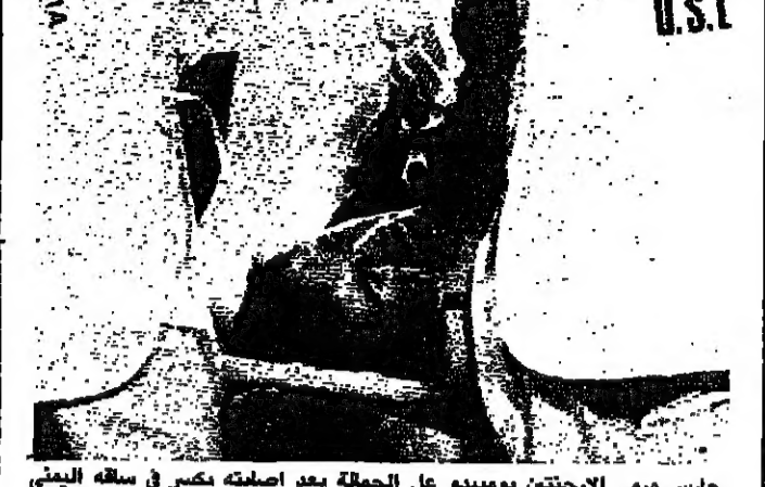
حارس مرى الأرجنتين بومبيو على الحمله بعد اصليته بكرى في سلقه البيس

ضمن المهاجم الاسباني مارتينو، تخصص جزء من المندرجات لتتبعه في كأس العالم بأحضره فريقه الآت خاصة إلى إيطاليا، وتضم الفرقة مقيمين متخصصين للمنتخبين، وقد أمكن مشاهدتها والأهم من ذلك سماعها بالاستدقاء أثناء مباراة إسبانيا وأوروغواي.